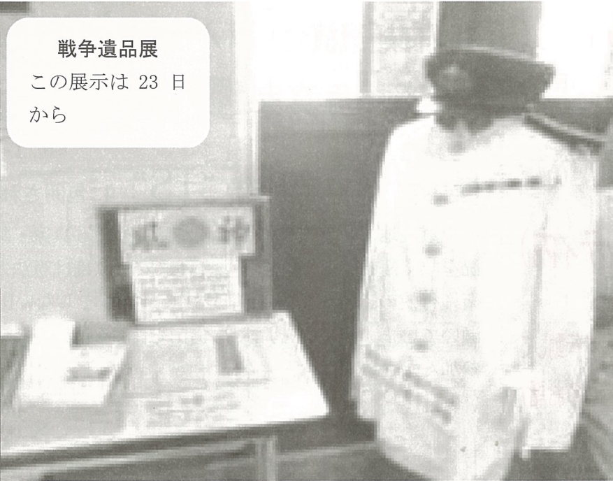
戦争遺品展 この展示は 23 日 から