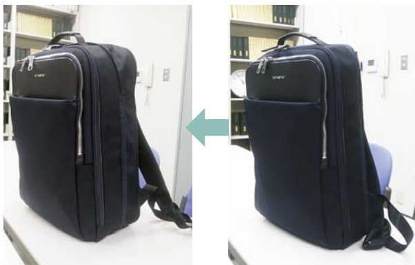
チャックを開くと大きくなります!