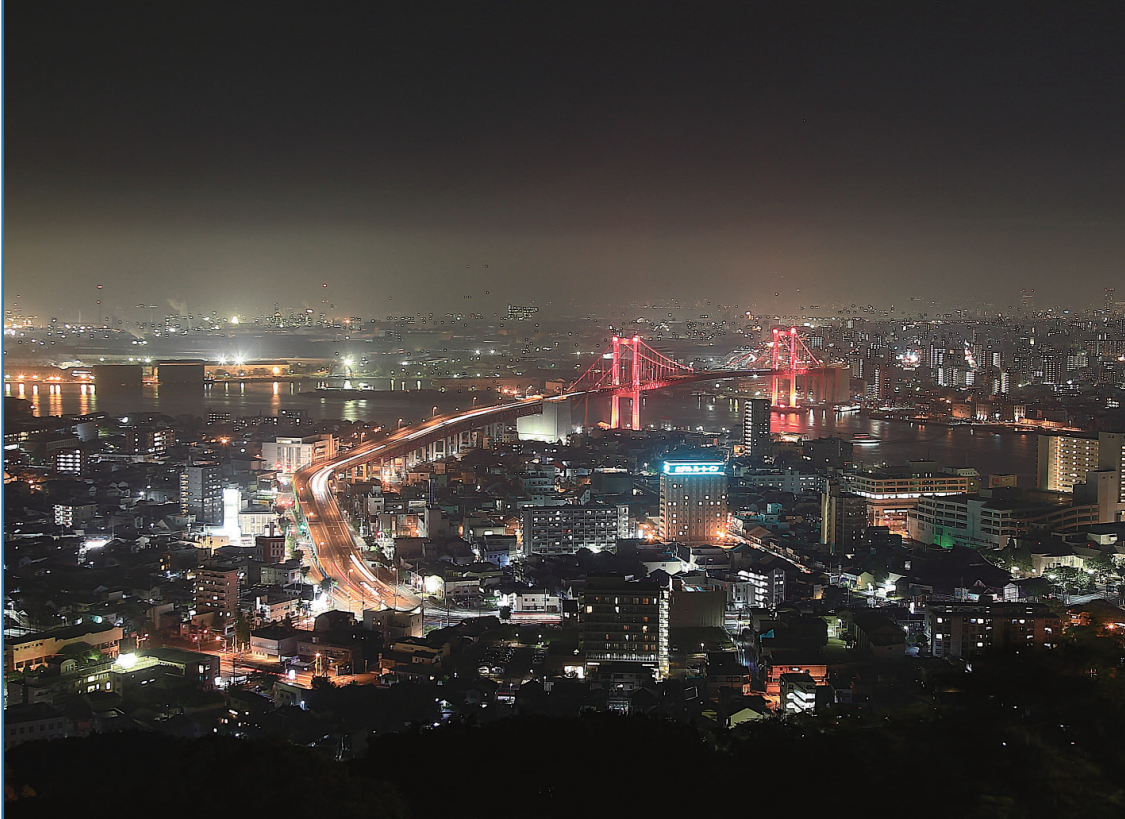
高塔山公園